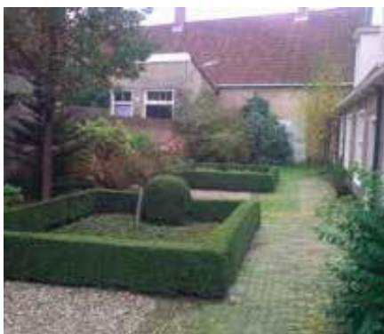
Overzichtelijke tuin en woonomgeving