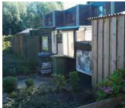
Containers in de voortuin of op gemeenschappelijk achterpad