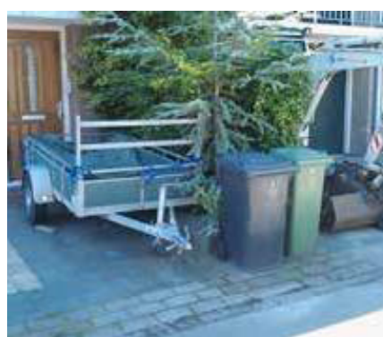
Belemmering uitzicht/weinig overzicht/onveilig